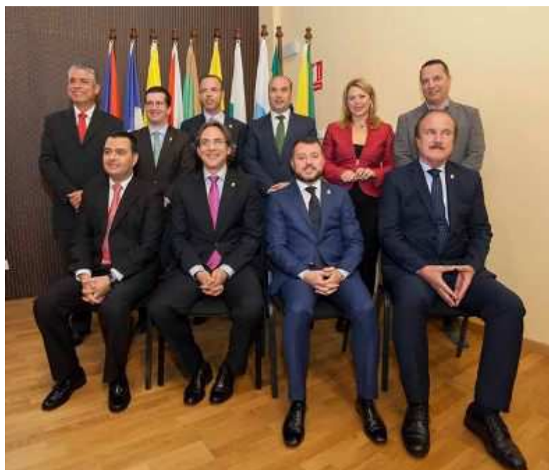
Acto de cambio de Presidencia de la Mancomunidad, celebrado el 15 de enero de 2016.

Durante el año 2015, el municipio de Gáldar ha ostentado la presidencia de la Mancomunidad, siendo un año en el que se han celebrado elecciones locales en España. Este hecho supuso la constitución de un nuevo pleno de la Mancomunidad en el mes de junio, tras la elección de los nuevos ayuntamientos y la nueva designación de representantes por parte de los mismos, de conformidad con los Estatutos de la Mancomunidad.