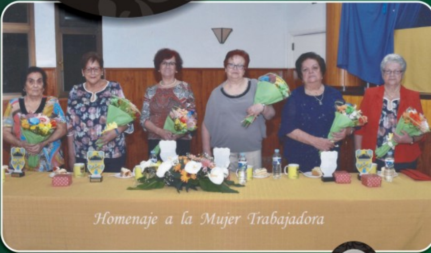
Homenaje a la Mujer Trabajadora

Estas seis mujeres representan a la MUJER TRABAJADORA en esta edición.